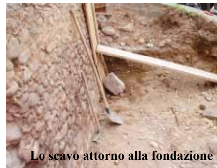
Lo scavo attorno alla fondazione