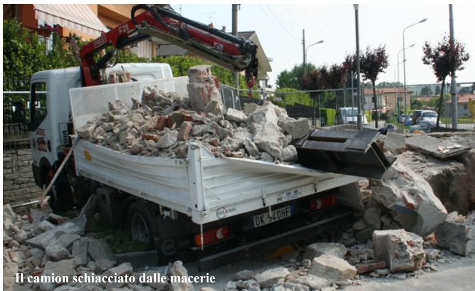
Il camion schiacciato dalle macerie