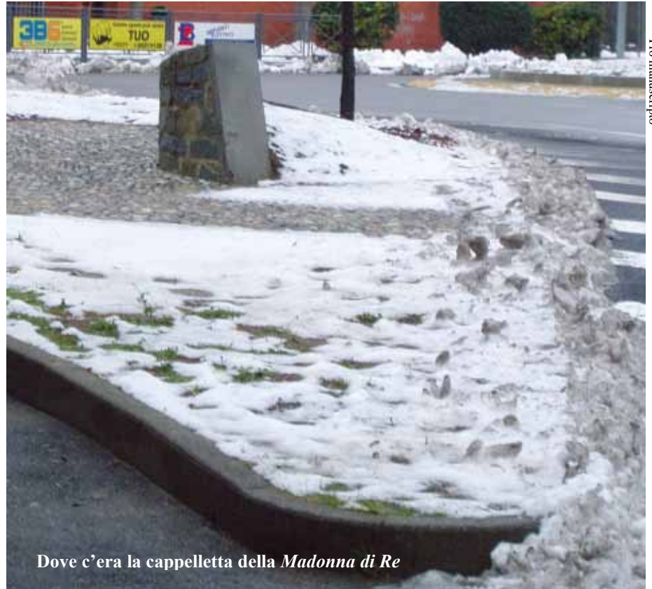
Dove c'era la cappelletta della Madonna di Re

Già, ma la sinistra sta forse a guardare? No, certo.